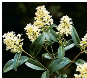
Liguster (gemeiner) 3