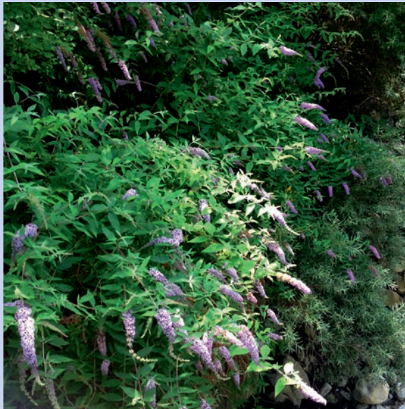
Foto: Sommerflieger buddleja davidii

Gesucht: Sommerflieger (auch bekannt als: «Schmetterlingsstrauch»).